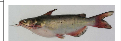
チャネルキャット▲ フィッシュ